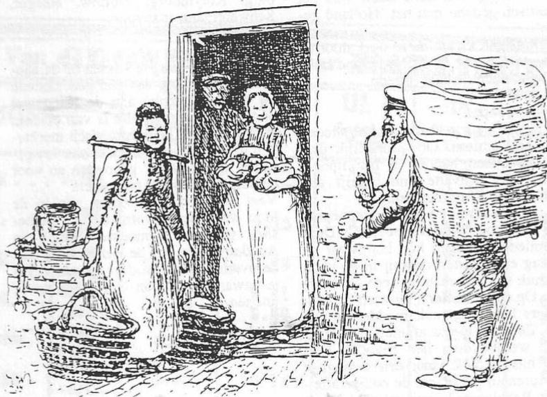
Rechts op de tekening staat een 'lapkepoep' afgebeeld. Hij staat hier met zijn koopwaar op de rug bij de deur van een woning. (tekening Ids Wiersma)

Ze hadden dan de gewoonte om de was te doen in lauwe wei en het met regen- water na te spoelen. In de begintijd kwam men uiteraard te voet. Om- streeks 1860, toen de trein begon te rij- den, maakten ze hier ook wel gebruik van. In Nieuweschans begon dan de treinreis. Nadat de 'ûngetiid' over was en de klus was geklaard ging het weer op huis aan. Men verzamelde zich vaak luid zingend op het Leeuwarder station en iedereen was blij om met het ver-